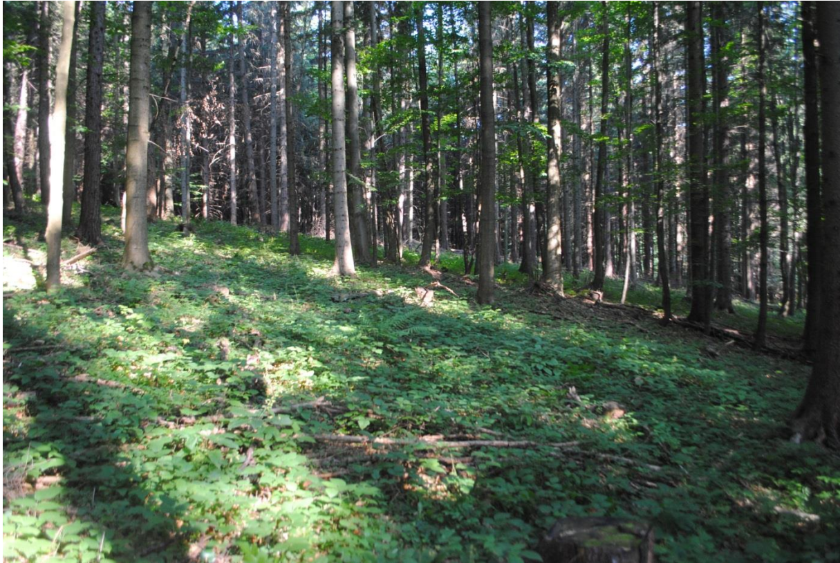
Porast 259a v roku 2018