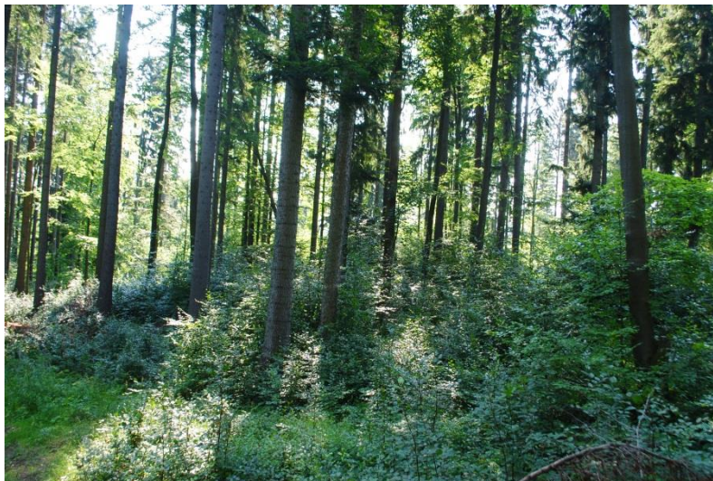
Vzniknuté prirodzené zmladenie Fagus sylvatica po výbere porast 259b

Porast 259 b bol už pri zakladaní objektu vo fáze obnovy. Podľa predpisu PSL bola navrhnutá obnova maloplošnými clonnými rubmi v pásoch. Z dôvodu terénnej dostupnosti a stavu porastu sa vyhodnotila ako vhodnejšia alternatíva prebudova na TVP pomocou následnej generácie. Vzhľadom na drevinovú skladbu buk – smrek – jedľa bol navrhnutý veľkoplošný bádenský clonný rub s dlhou obnovnou dobou (30 – 40 rokov). Pri takto dlhej obnovnej dobe by mal následný porast vykazovať známky plošnej, vekovej i drevinovej diferenciácie. V prvej fáze bádenského clonného rubu boli odstránené jedince zdravotne poškodené a rubne zrelé stromy po kulminácii hodnotového prírastku s priemerom kmeňa nad 60 cm v d 1,3 .