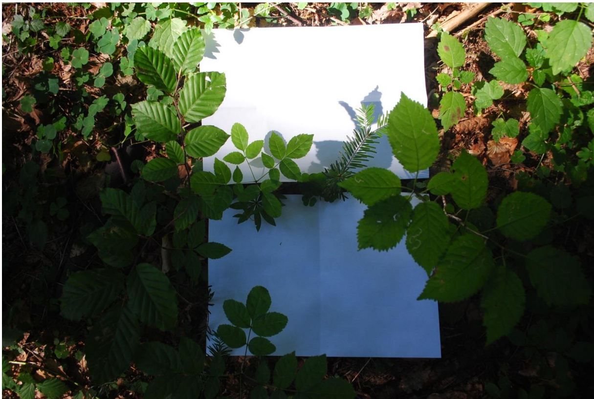
Por. 259a prirodzené zmladenie rok 2018 – Abies alba , Fagus silvatica , Ulmus glabra , Fraxinus excelsior