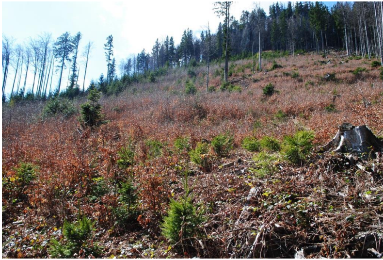
JPRL 258a po dorube, pohľad zhora