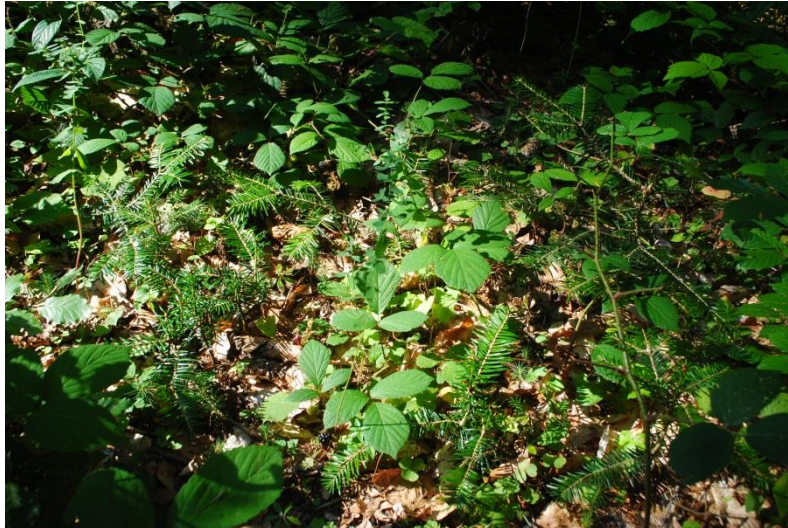
Vzniknuté prirodzené zmladenie Abies alba po výbere porast 259b